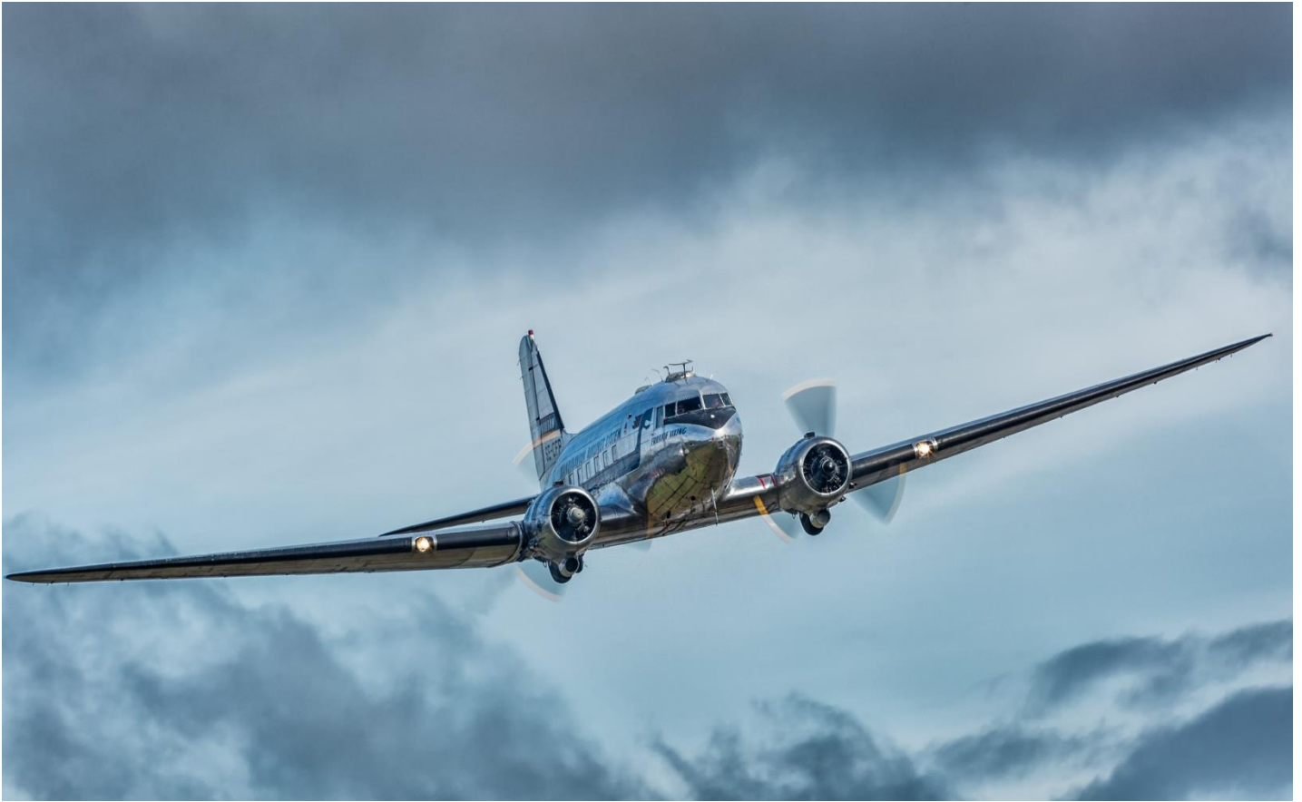
Daisy medlemsflygning