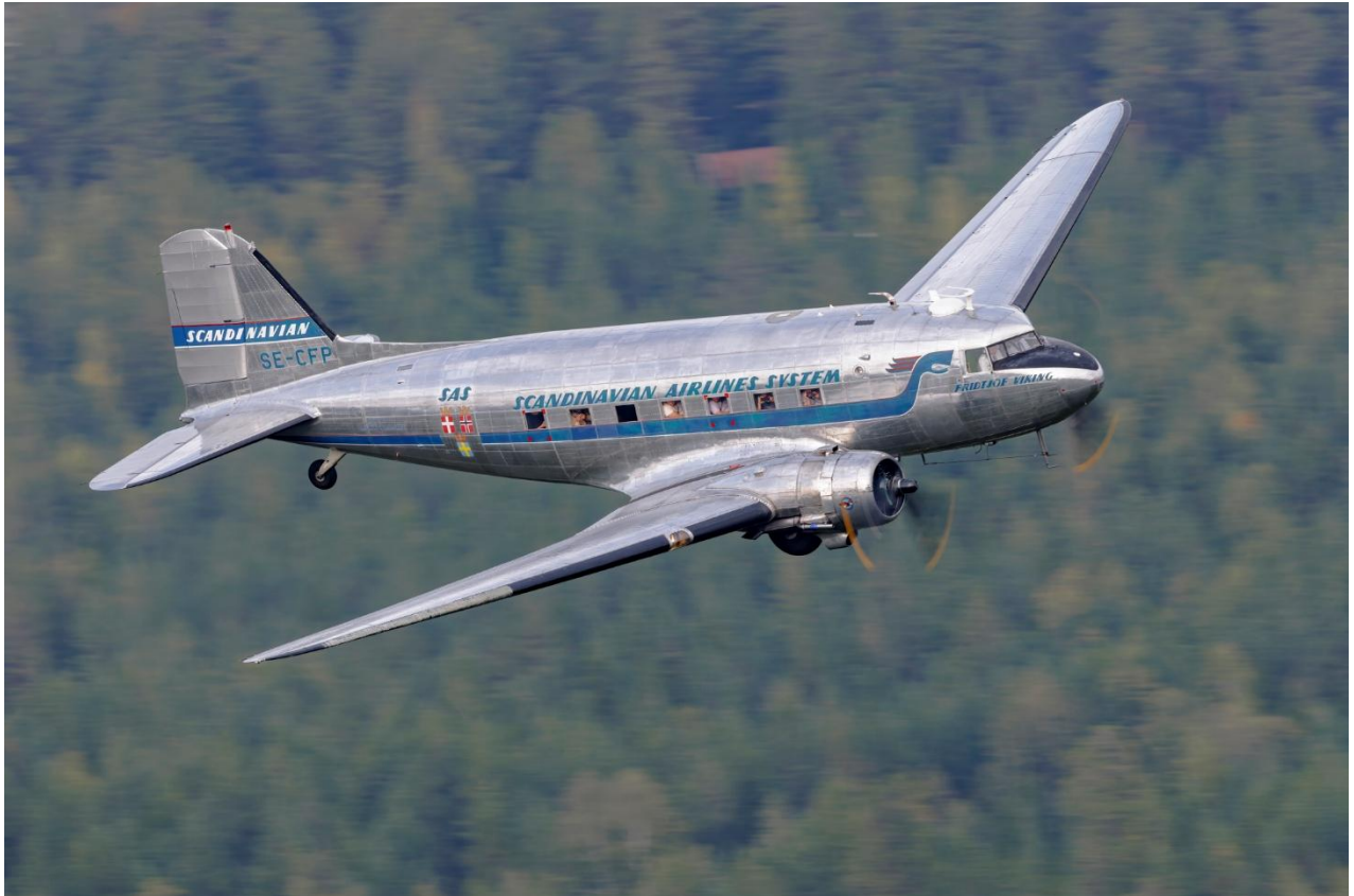
Daisy medlemsflygning