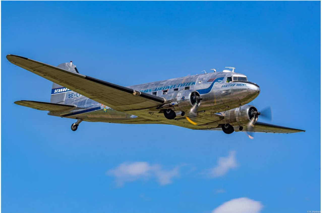
Daisy över Västerås